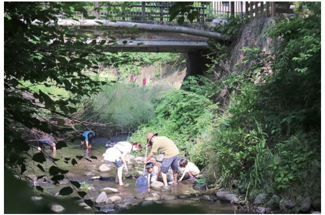
栄区 いたち川稲荷橋下