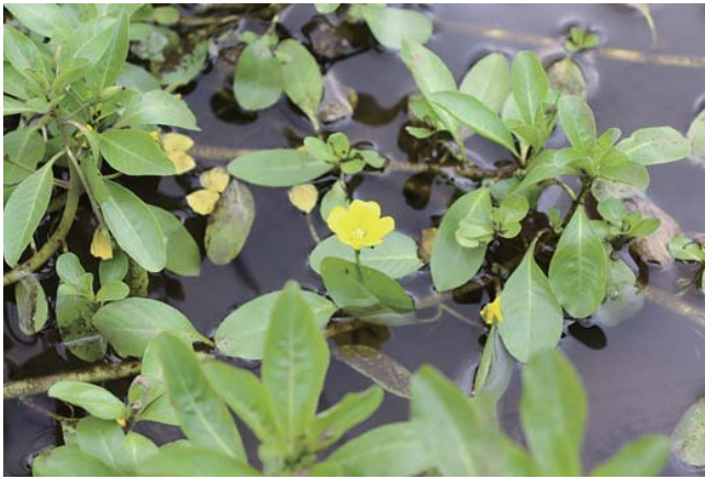
戸塚区 柏尾川の水ズキンバイ(絶滅危惧種)

退職等年金給付(年金払い退職給付)のしくみ …………… 3 今年度も「総合健診・がん検診」を受けましょう …………… 4 食塩控えめの生活習慣病改善サポートレシピ …………… 4